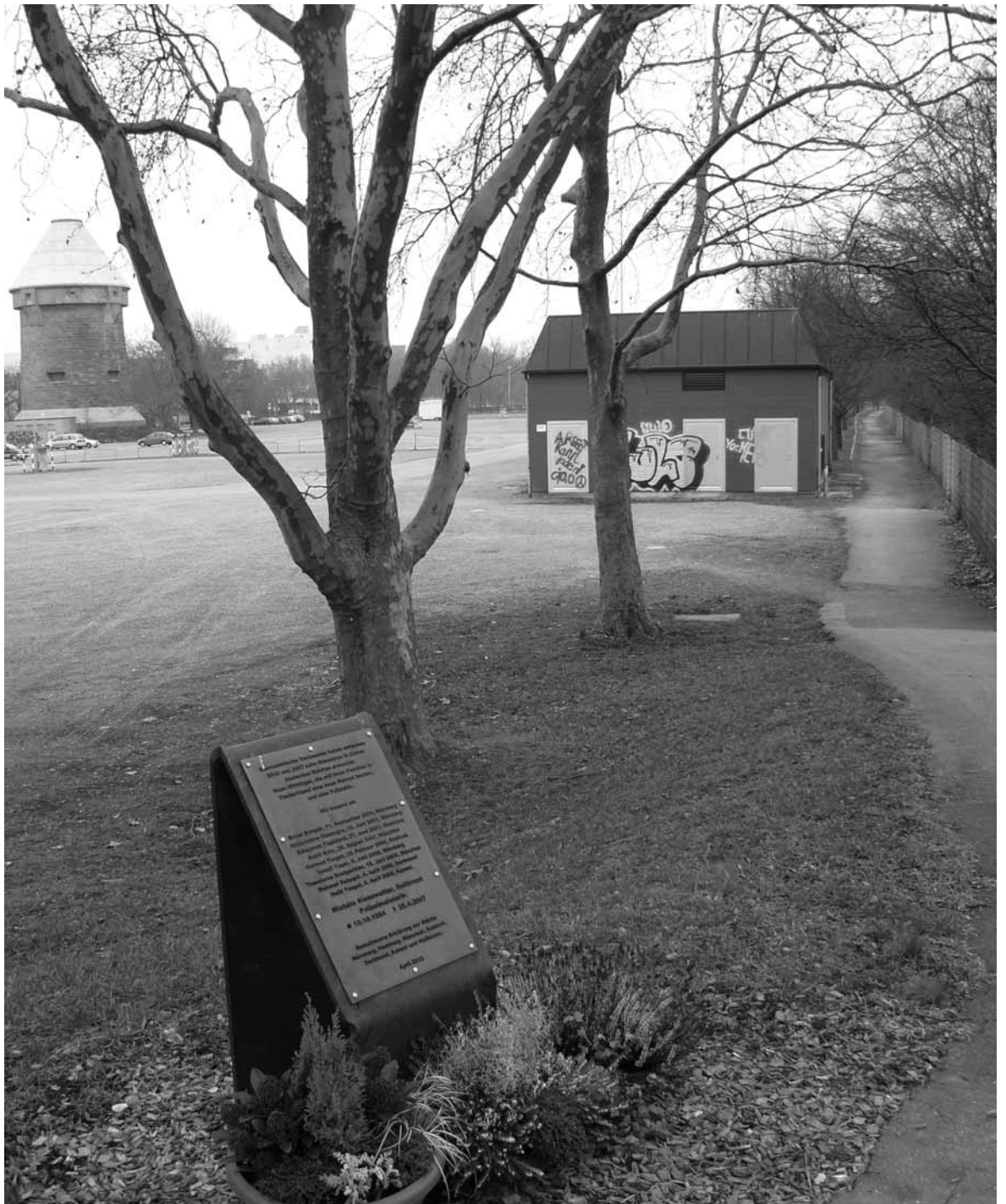
Tatort Heilbronn, Theresienwiese