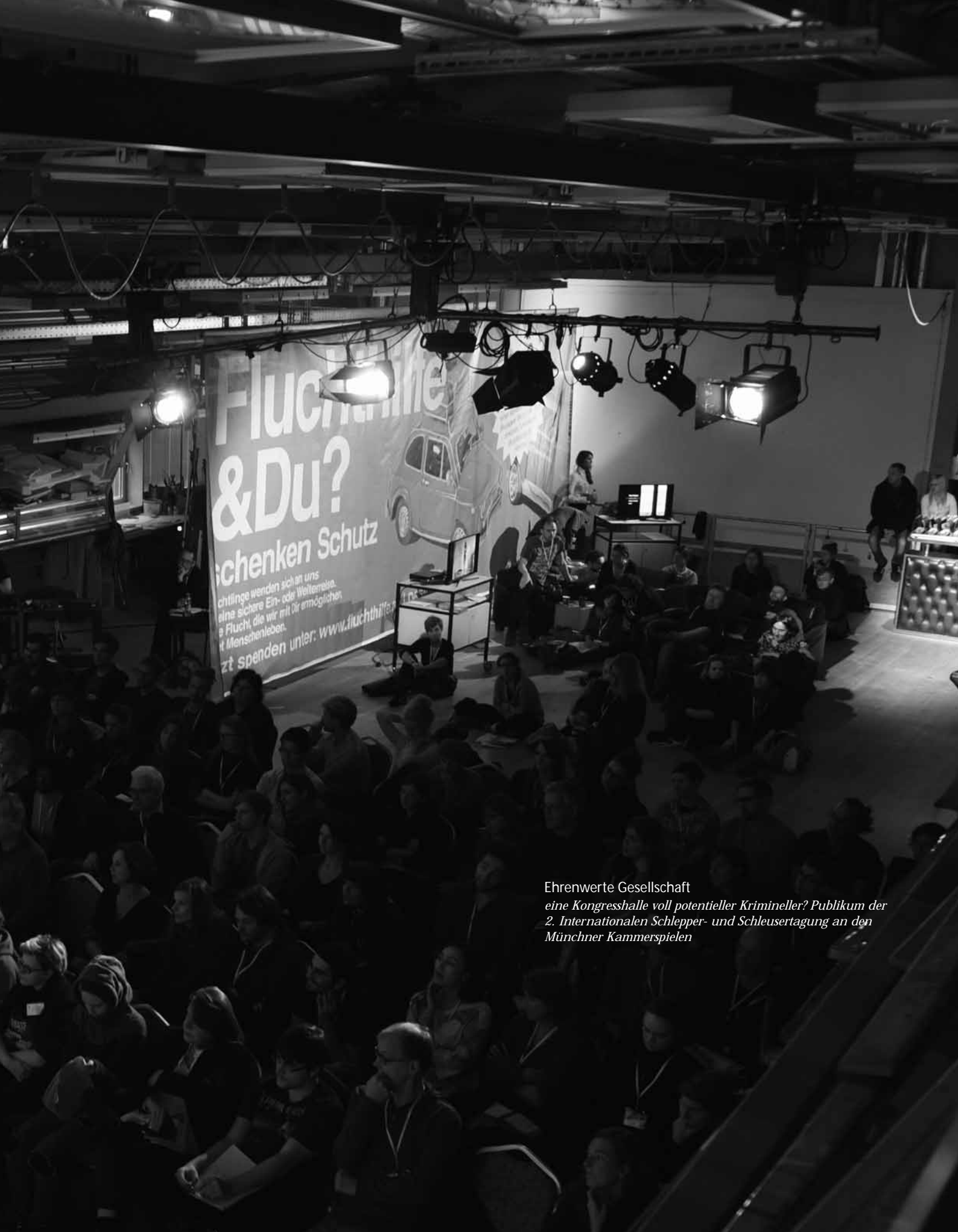
Ehrenwerte Gesellschaft eine Kongresshalle voll potentieller Krimineller? Publikum der 2. Internationalen Schlepper- und Schleusertagung an den Münchner Kammerspielen