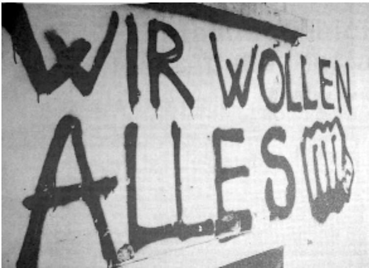
Ein antikes Graffiti aus der Zeit der Arbeiterkämpfe

dingungen wären nicht richtig geregelt, so etwas wie einen wilden Streik gemacht haben, sind im Grunde genommen benützt worden, um das zu bewirken, was die Mailänder Akteure in der BRD seit vielen Jahren versuchen, nämlich eine Konfrontation zwischen ausländischen Arbeitnehmern und deutschen Arbeitnehmern herbeizuführen. [...] Es muss einmal sichtbar gemacht werden, wer im Hintergrund solcher Aktionen steht, weil wir, die IG Metall, als verantwortliche Organisation in der Metallindustrie, auch im Zuge dieser Maßnahmen angesprochen werden [sic], nämlich mit der Bemerkung wir hätten überhaupt nichts getan, um die Interessen der italienischen Arbeitnehmer, sprich der ausländischen Arbeitnehmer zu vertreten. Was diese italienischen Arbeitnehmer hier bei BMW anbelangt, kann das richtig sein diese Erklärung; sie waren auch nicht gewerkschaftlich organisiert und wir sind nicht dazu da, Probleme nichtorganisierter Arbeitnehmer gewerkschaftlich zu lösen“.