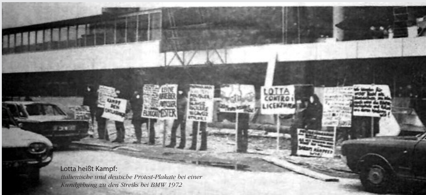
Lotta heißt Kampf: italienische und deutsche Protest-Plakate bei einer Kundgebung zu den Streiks bei BMW 1972