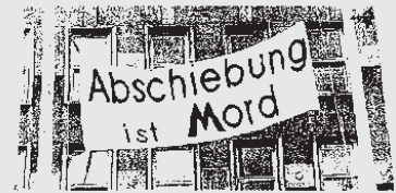
Menschen Böhren vor Verfolgung, Hunger und Elend. Sie fanden hier den Tod.

Die Dokumentation umfaßt Todesfälle und Verletzungen bei Grenzüberquerungen, Selbstmordversuche und Verletzungen von Flüchtlingen aus Angst und auf der Flucht vor Abschiebungen; Todesfälle und Verletzungen vor und während Abschiebungen, Mißhandlungen und Folter nach Abschiebungen. Die Zusammenstellung umfaßt auch Brände und Anschläge auf Flüchtlingsaufnahmestellen. Die beschriebenen über 3000 Einzelschicksale machen deutlich, daß die Chance, in der BRD Schutz und Sicherheit zu finden, gegen Null läuft. Die Lebensbedingungen für Flüchtlinge sind heute brutaler denn je ( www.anti-berlin.org/doku.html )