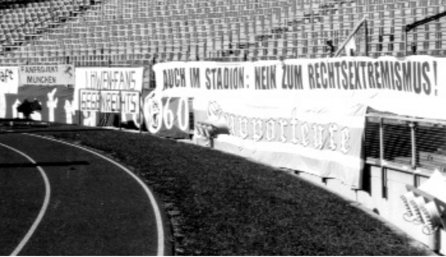
Die Löwenfans gegen Rechts zeigen auch im Stadion Flagge

Auch der Sportjournalist der SZ, Redakteur Ralf Wiegand, ist von derlei Gedankengut nicht frei: