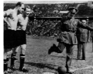
Der britische General Byrnes übergibt das Berliner Olympiastadion 1949 wieder an die Deutschen