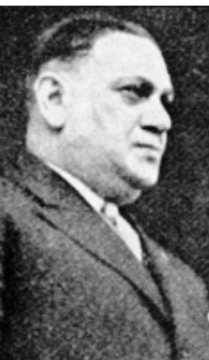
Kurt Landauer Präsident des FC Bayern von 1913 bis 1951. Seine Amtszeit ward drei mal jäh unterbrochen

mit zunehmender Popularität der „Fußlümmelei“ entschlossen sich einige Turnvereine, die Organisation des Spiels unter Kontrolle zu bringen, unter anderem der Männerturnverein München (MTV). Im Jahre 1897 wurde dort eine eigene Fußballabteilung gegründet. Doch als sich die Fußballabteilung einer überregionalen Liga anschließen wollte, sah der Turnverein das Vereinsziel verfehlt. Daraufhin traten elf Spieler geschlossen aus und gründeten 1900 den FC Bayern München.