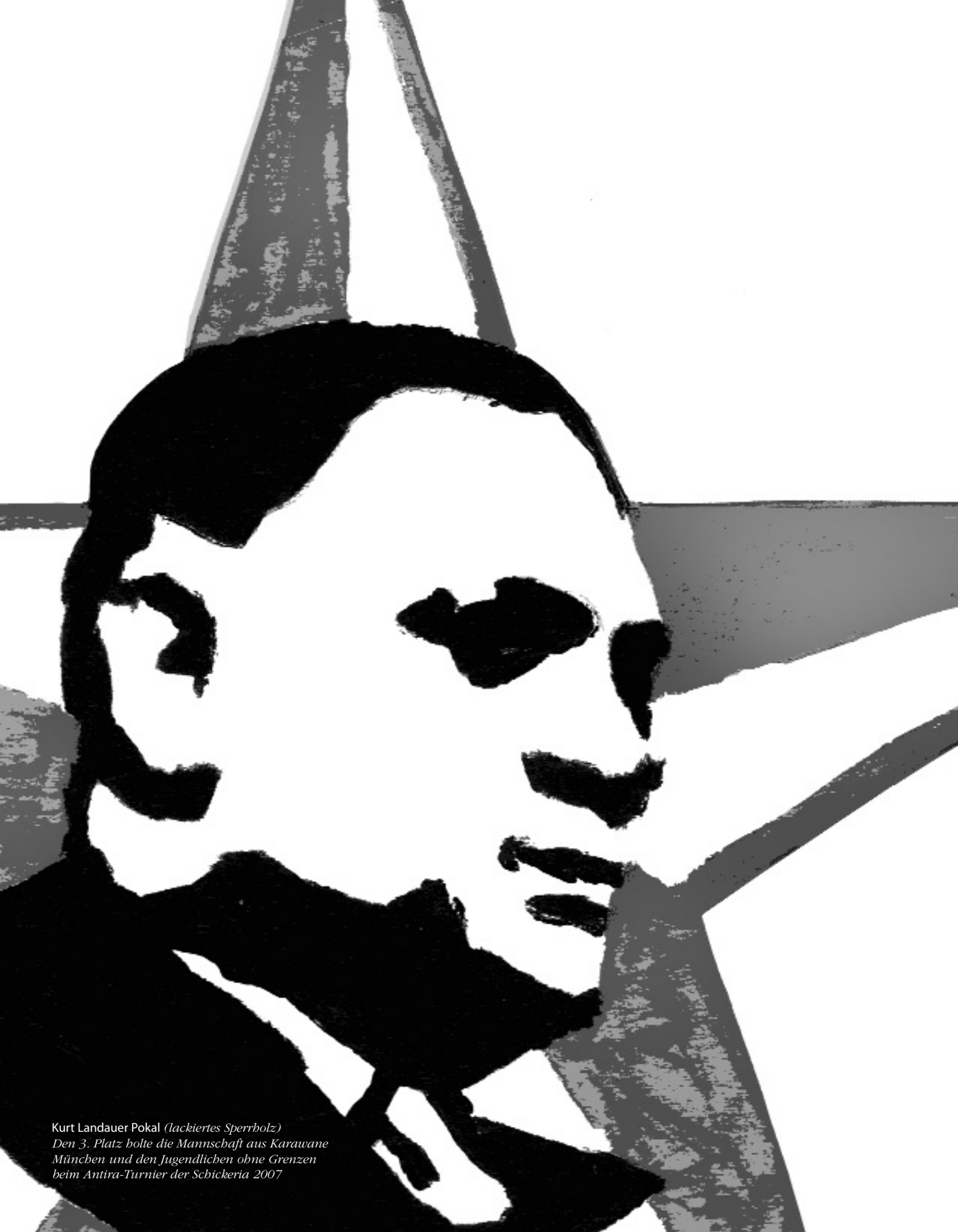
Kurt Landauer Pokal (lackiertes Sperrholz) Den 3. Platz holte die Mannschaft aus Karawane München und den Jugendlichen ohne Grenzen beim Antira-Turnier der Schickeria 2007