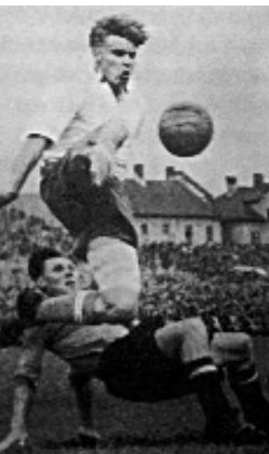
Rasant. Der Bayernstürmer Herbert Moll

„Die Bayern: ein Staat im Staat. Oberster Verfassungsgrundsatz im FC-Bayern-Land: Alles hat zum Wohle des Klubs zu geschehen. Die von so viel Selbstgefälligkeit überrollten Anhänger sprechen von ihrem Verein eingeschüchtert als „das System“ oder „die AG“, als handele es sich um eine Diktatur. Die ausgeschlossenen Fan-Klubs, die sich pauschal verunglimpft sehen, resignieren vor der Medienmacht FC Bayern. Bisher polarisierte der Verein nur die Lager, nun spaltet er die Basis seines Rubms: das eigene Volk.“